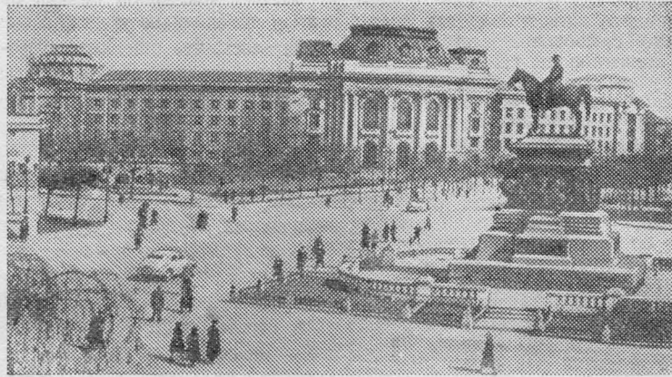
Народная Республика Болгария. Здание Софийского университета.