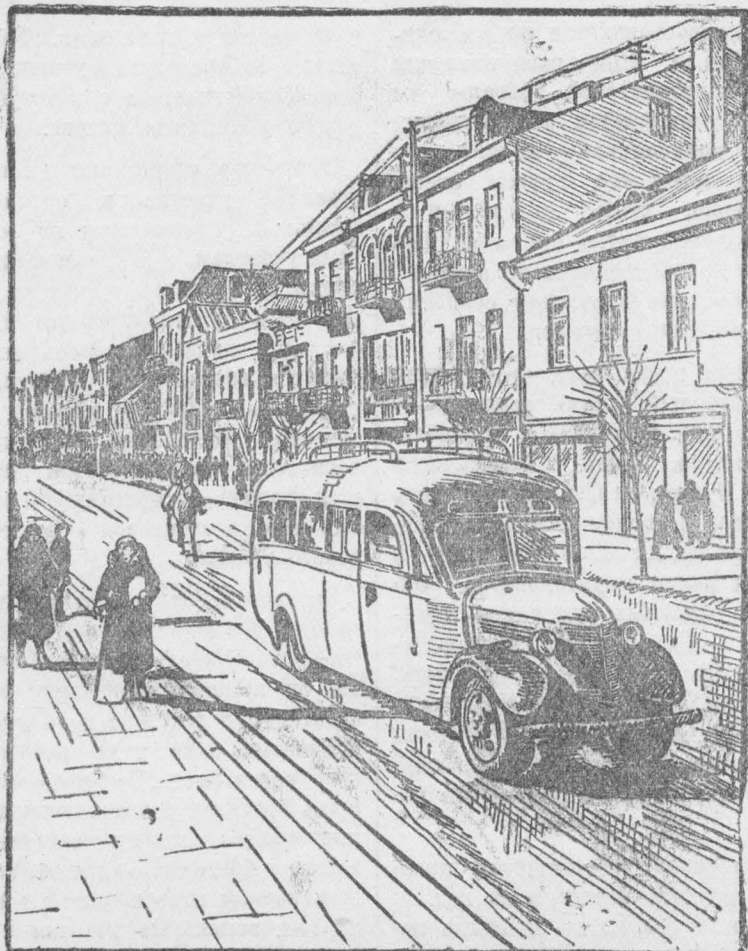
На снимке: Советская улица в Белостоке.