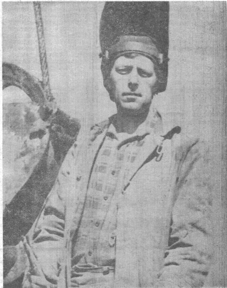
Материал подготовил А. Елизаров.

Чем меньше механизмов стоит в парке на ремонте, тем лучше у Владимира и его товарищей настроение. Значит техника в ремонте не нуждается. А это главный показатель в их работе.