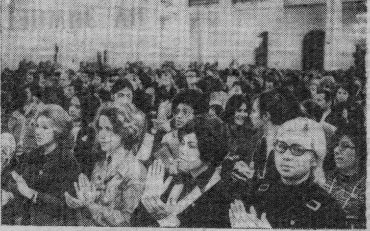
Москва. Участницы Всемирной встречи девушек в Колонном зале Дома союзов.

Причины низких результатов — неадекватная подготовка животноводческих помещений, плохая организация труда животноводов, недостаточный запас кормов на фуражных дворах. Сейчас главная задача — ликвидировать отставание, до глубоких снегов доставить грубые корма к фермам, организовать действенное социальное внимание, наладить строгий контроль за расходом кормов и подготовкой их к скормли-