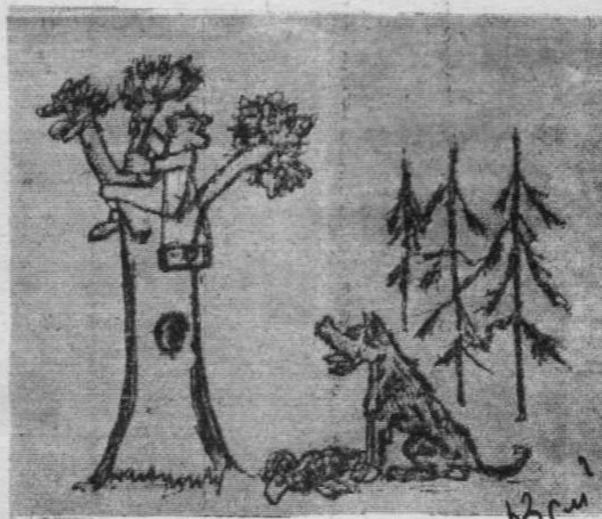
— По-хорошему говорю, засвети пленку!