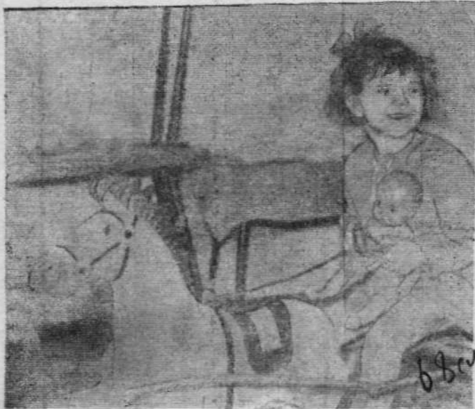
Куклу нужно отправить в больницу.

Ленинская партия родная, Сколько у тебя о нас забот! По стране от края до края Племя юных ленинцев растет. Т. ЛЮБИМОВА.