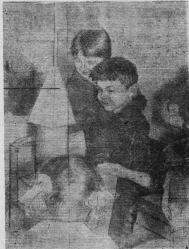
Мы строим дом.