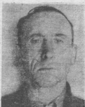
А. В. Делья скотник