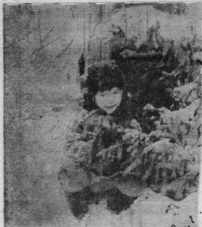
«Хитрая лиса» спряталась под елочкой.