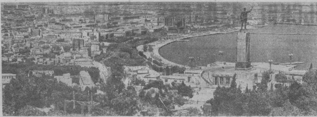
Баку — столица Азербайджанской ССР.