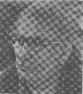
На снимках (сверху вниз): народный писатель Азербайджана Сулейман Рагимов;