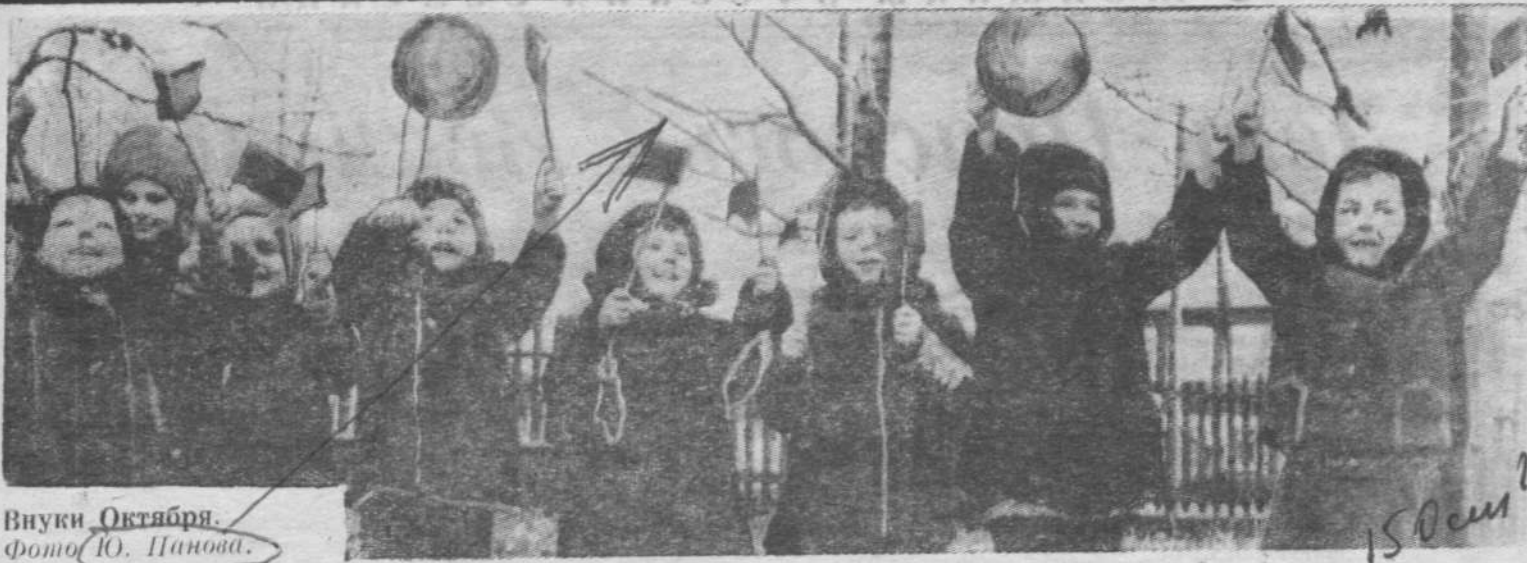
Внуки Октября.