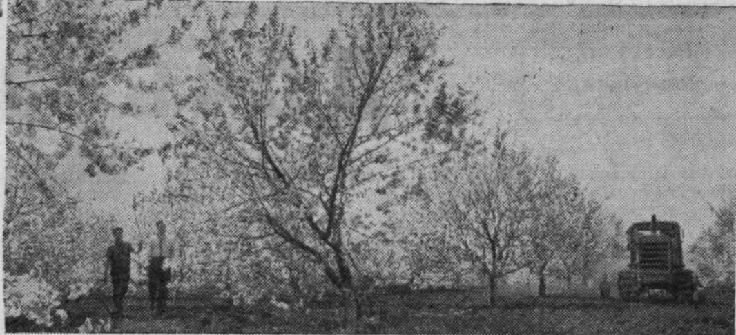
Молдавская ССР. Садоводы учебного хозяйства «Криуляны» решили вырастить высокий урожай фруктов на 650 гектарах плодоносящего сада. Сейчас проводится междурядная обработка (на снимке).