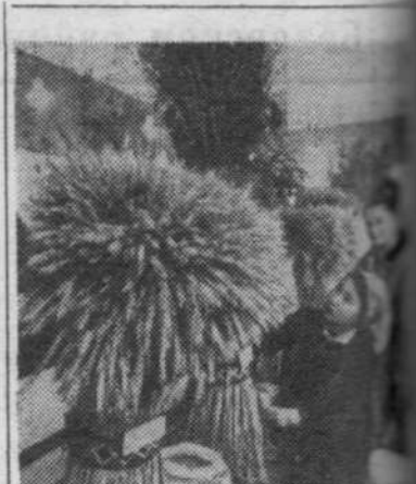
В Якутске открыта выставка достижений народного хозяйства Якутской АССР. В залах размещены сотни экспонатов, рассказывающих об огромных экономических и социальных преобразованиях в республике за 50 лет. На снимке: посетители осматривают морозостойчивую пшеницу «Якутянку», выведенную селекционерами Научно-исследовательского института сельского хозяйства.