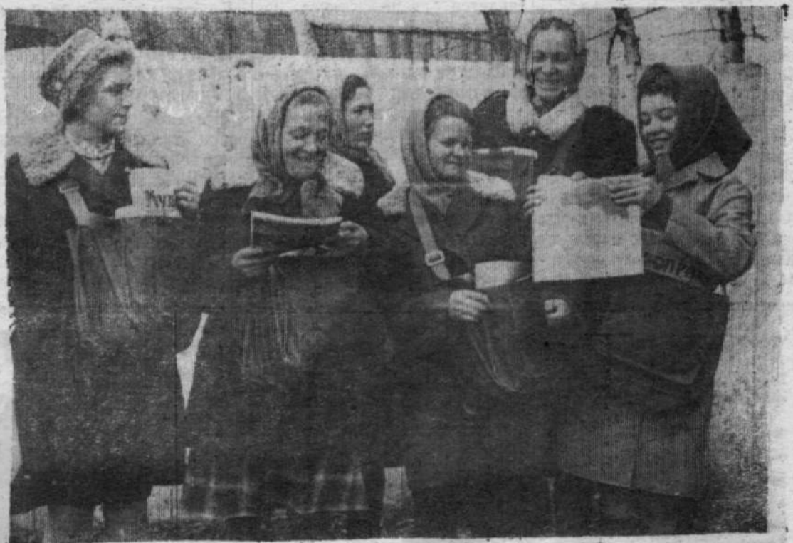
Каждое утро во все концы районного села идут эти женщины с полными сумками газет, журналов, писем и другой корреспонденции. Особенно много хлопот у почтальонов в предпраздничные дни. Сотни открыток и поздравительных телеграмм разносят они крапивин-