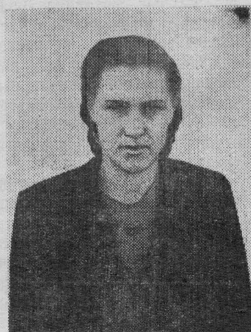
дойрка Мунгатского совхоза, депутат районного Совета.