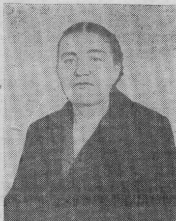
свинарка колхоза «Коминтерн», депутат областного Совета.