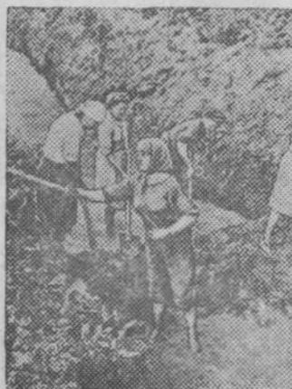
В обводном канале.