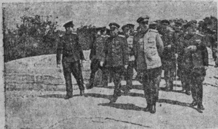
Представители Советского Военного Командования во главе с Маршалом Советского Союза Василевским осматривают исторические места обороны русских крепостей Порт-Артур в 1904 году.

«Что касается снабжения Красной Армии продовольствием и обмундированием, то всем известно, что фронт не только не испытывал в этом отношении какого-либо недостатка, но имел даже при себе необходимые резервы».