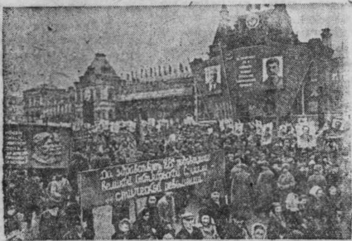
Демонстрация трудящихся Москвы 7 ноября 1945 года.