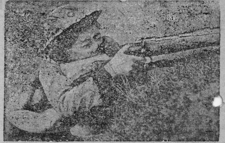
НА СНИМКЕ: Девушка — курсант военной школы на тактических занятиях.