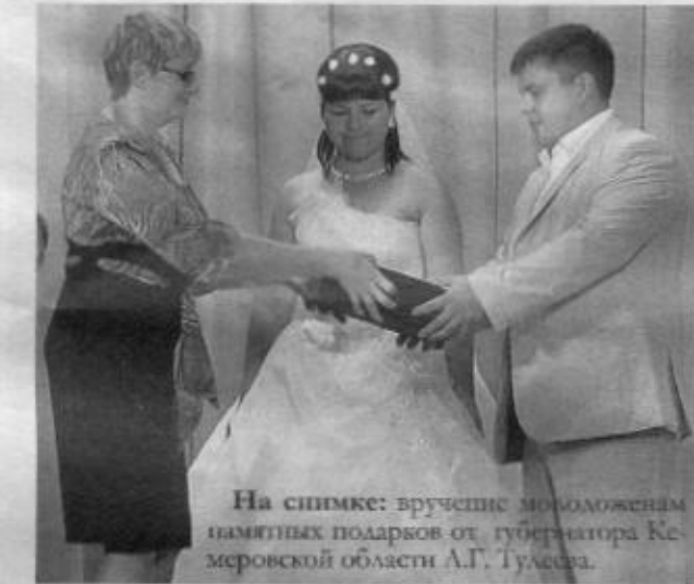
На снимке: вручение молодоженам памятных подарков от губернатора Кемеровской области А.Г. Тулусова.

Но самым зрелищным и трогательным моментом стало награждение повобра-