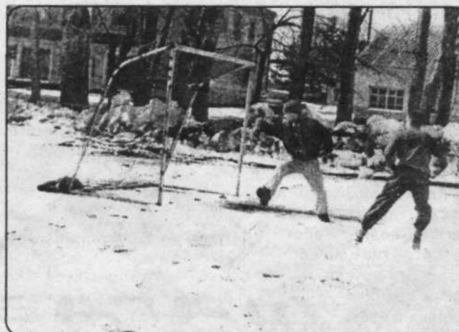
На снимках: моменты игры.