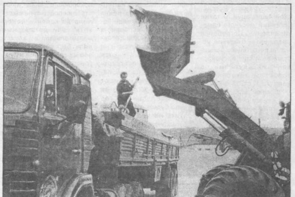
Погрузка и отправка