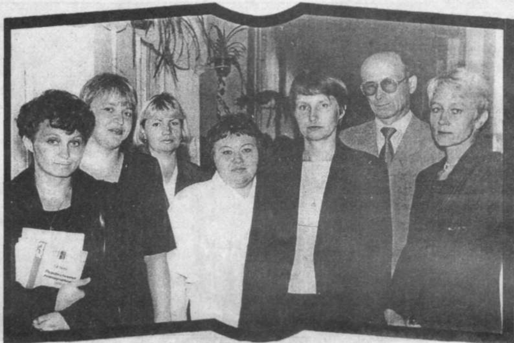
Делегация учителей Зеленогорской средней школы