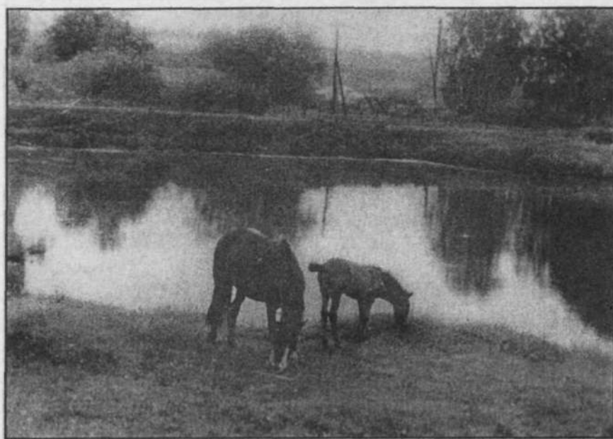
Рядом с мамой жеребенок.