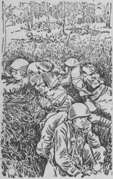
На огневой позиции. („Сов. Сибирь“)