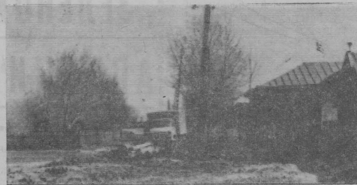
...а у его соседа—№ 84?!