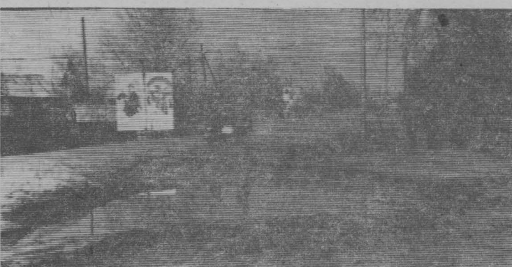
Знаменитая лужа у межрайбазы.