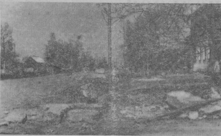
—Что оставили после себя строители?