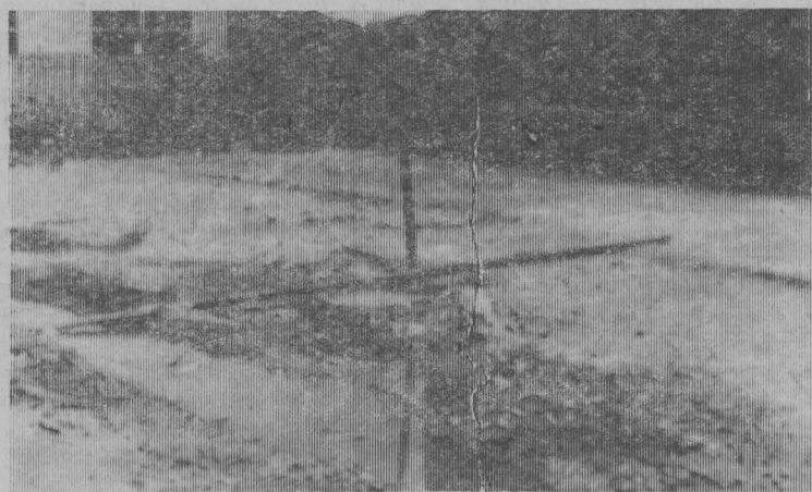
Пора бы санэпидстанции (т. Ударцев) обратить свое внимание на дом № 8, что в Микрорайоне. Текст и фото А. БОЯРСКОЙ.

Недавнее нападение гватемальских карателей на испанское посольство и убийство 39 человек, в том числе укрытых там крестьян-индейцев, — еще одно звено в цепи преступлений военно-диктаторского режима. Как ни пытаются гватемальские власти замести следы (похищен из больницы и убит выживший крестьянин—свидетель трагедии), правды не скрывать: это была хладнокровно рассчитанная антинародная операция, в которой проглядывает знакомый «почерк» репрессивного аппарата Гватемалы.