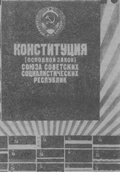
Плакат художника Ю. Кершина. Издательство «Плакат».