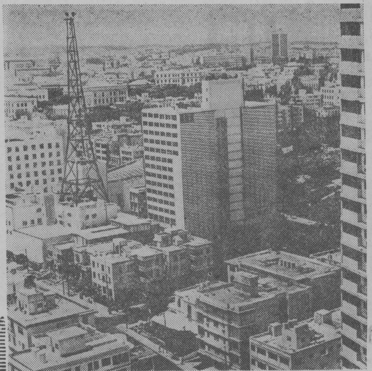
Гавана—крупнейший промышленный, культурный и научный центр, столица Республики Куба.