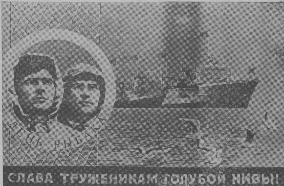
Плакат художника А. Рудковича. Издательство «Плакат».