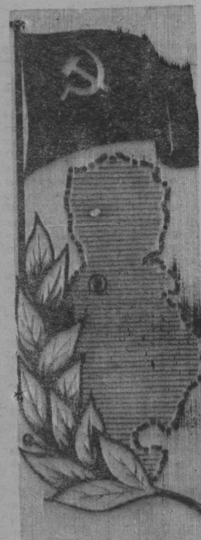
Президиум райкома союза рабочих и служащих сельского хозяйства, редакции газеты «Заря коммунизма» поднимают символический флаг в честь передовых доярок, добившихся за март лучших результатов в социалистическом соревновании.

За успехи, достигнутые в марте, по представлению партийных, профсоюзных организаций, администрации колхозов и совхозов этой чести удостоены доярки: