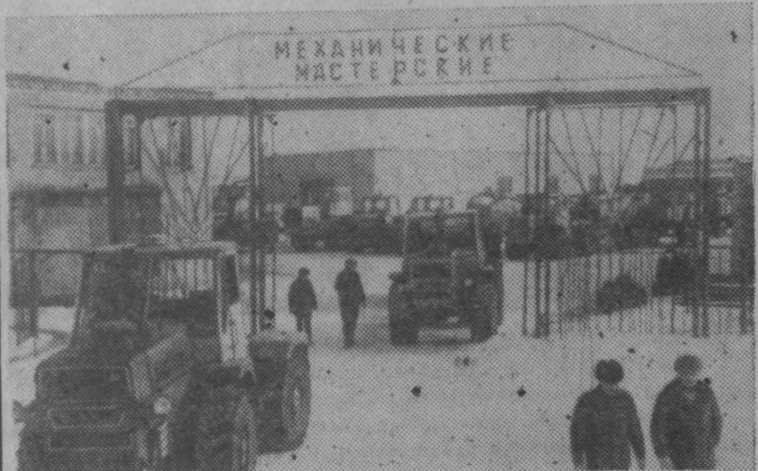
БЕЛОРУССКАЯ ССР. Есть на Могилевщине колхоз, куда учатся мастера земледелия и животноводства приезжают на разных уголках страны.

«Рассвет» — такое имя дали земледельцы колхозу более тридцати лет назад, когда собрались на свой первый послевоенный сход в разоренной, разрушенной войной деревне Мышковичи. Крепко верили люди в возрождение родной земли, в свои силы и в своего председателя — Кирилла Прокофьевича Орловского — участника партизанского движения в Белоруссии в годы Отечественной войны.