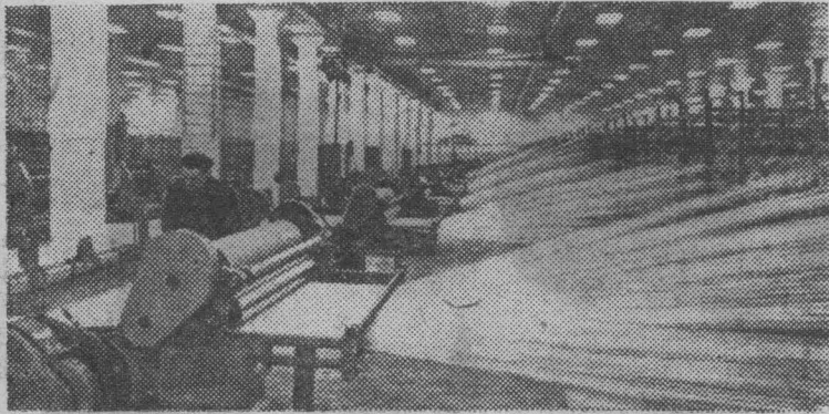
ЛАТВИЙСКАЯ ССР. Даугавпилский завод синтетического волокна имени 50-летия Ленинского комсомола—крупнейшее в республике предприятие большой химии. Его продукция—кордовая ткань для автопокрышек и другие синтетические материалы находят широкое применение в народном хозяйстве страны.