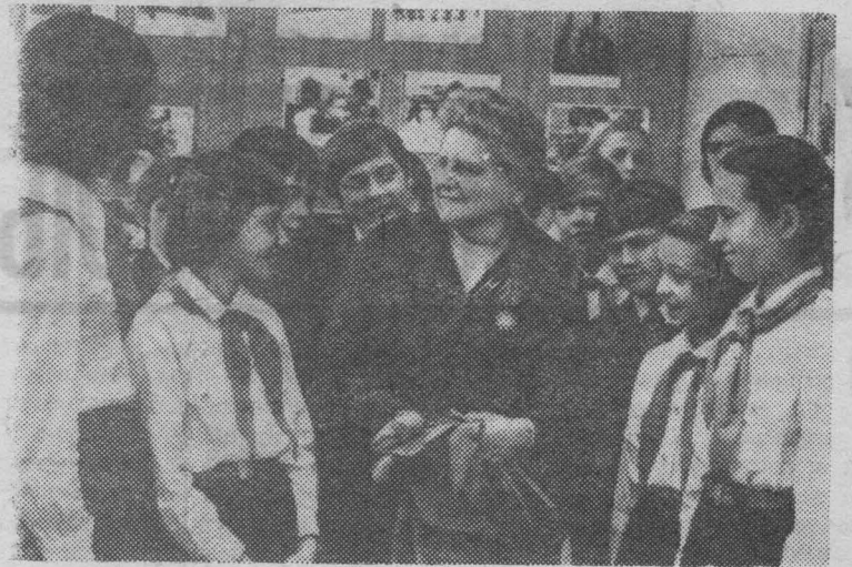
ЛИТОВСКАЯ ССР. В преддверии 60-летия Великого Октября молодежь республики встречается с ветеранами революционного движения, передовиками производства, деятелями культуры и науки.

По обсужденному вопросу сессия приняла соответствующее решение.