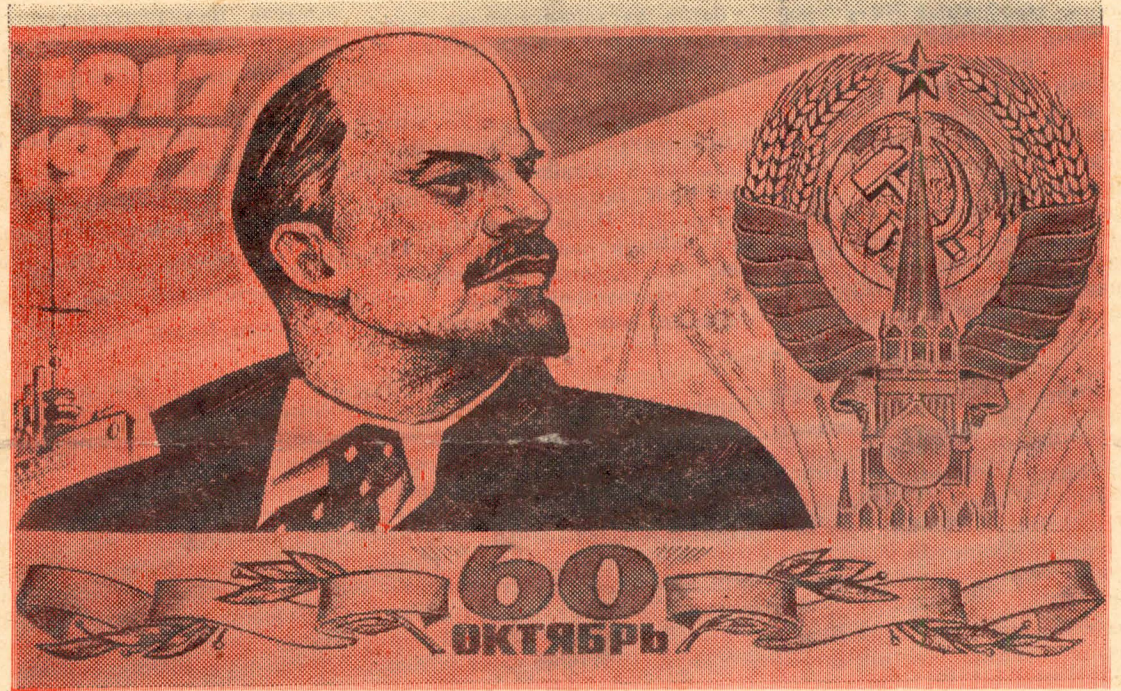
Плакат издательства «Московская правда».

Пленум принял развернутое постановление и приветственное письмо Центральному Комитету Коммунистической партии Советского Союза, Генеральному секретарю ЦК КПСС, Председателю Президиума Верховного Совета СССР тов. Л. И. Брежневу.