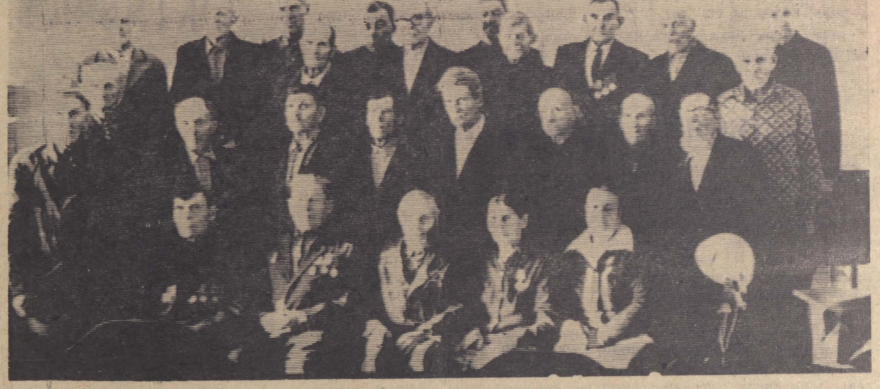
НА СНИМКЕ: ветераны гражданской войны.