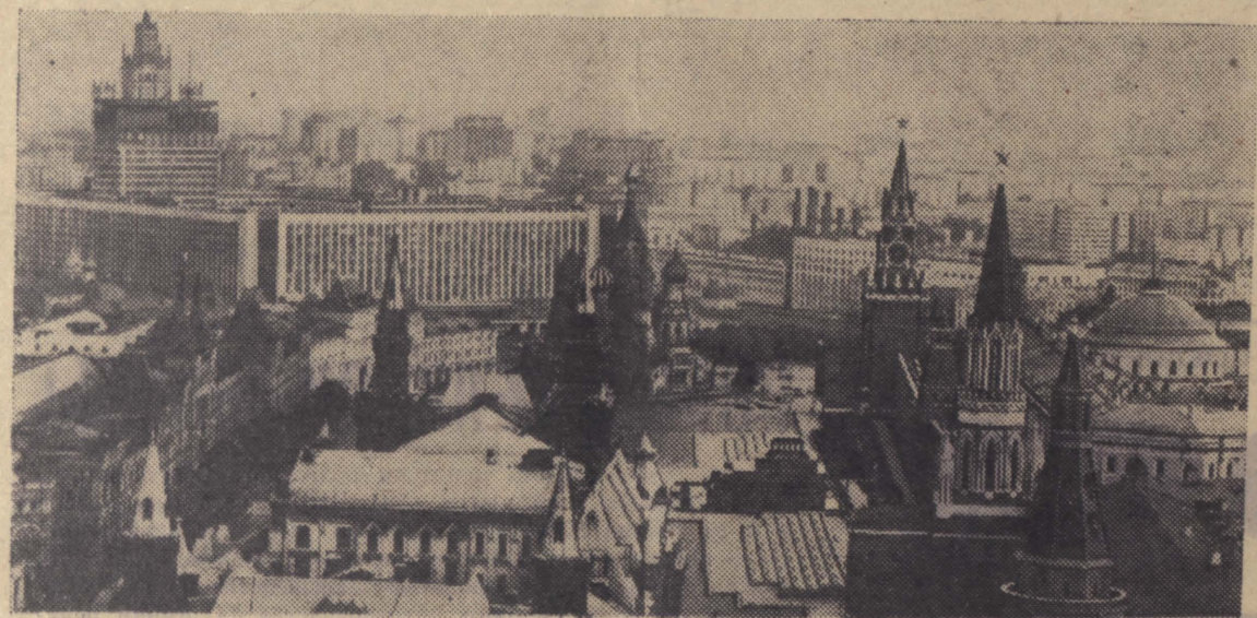
МОСКВА. НА СНИМКЕ: вид на Кремль, Красную площадь и гостиницу «Россия».