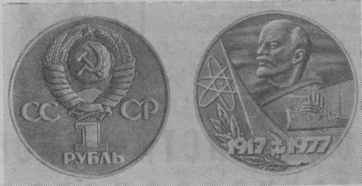
Юбилейная монета достоинством в 1 рубль, выпускаемая в обращение 1 ноября 1977 года в ознаменование 60-летия Великой Октябрьской социалистической революции.