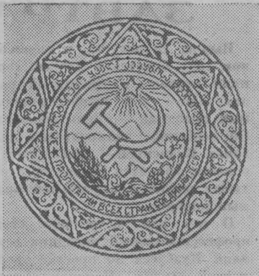
Герб Грузинской ССР.

Грузинская Советская Социалистическая Республика