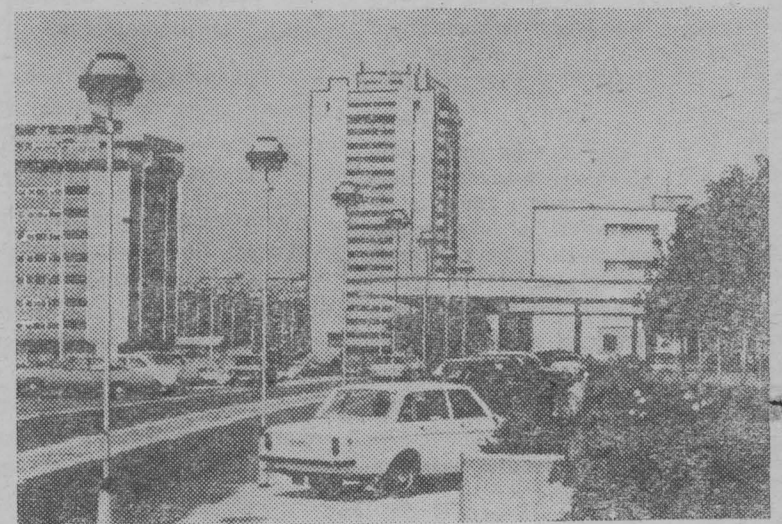
Самым крупным районом югославской столицы является Новый Белград (на снимке). По существу это целый город, рассчитанный на 250 тысяч жителей.