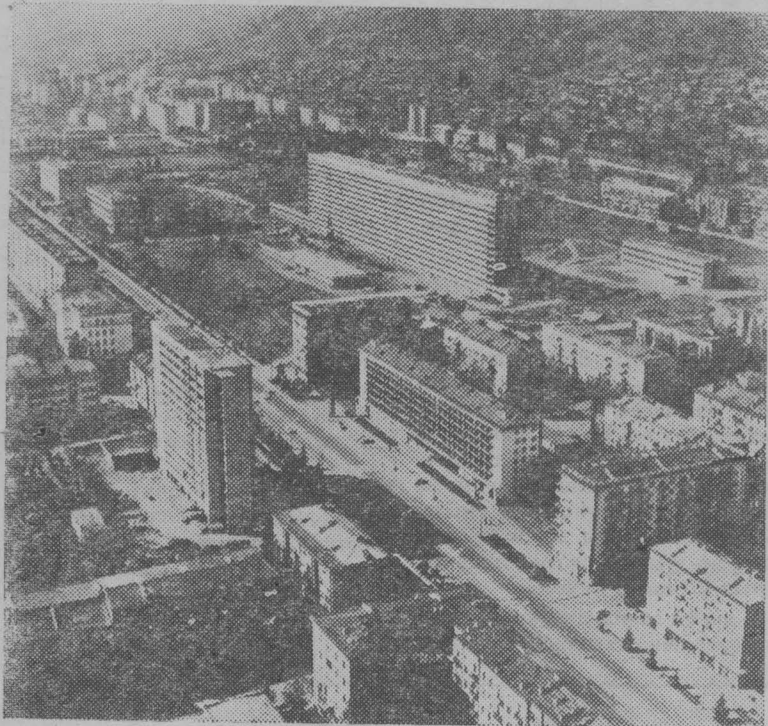
Столица Грузинской ССР Тбилиси. Новый архитектурный комплекс на проспекте Важа Пшавела в Орджоникидзевском районе.

Одиннадцать издательств республики ежегодно выпускают книги 2350 названий тиражом почти 17 миллионов экземпляров. Это значит, что на каждые сто человек приходится 350 книг и 40 периодических изданий на грузинском, русском, абхазском, осетинском, армянском, азербайджанском языках.