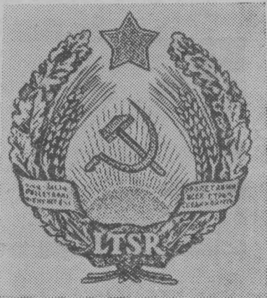
Герб Литовской ССР.

Литовская Советская Социалистическая Республика