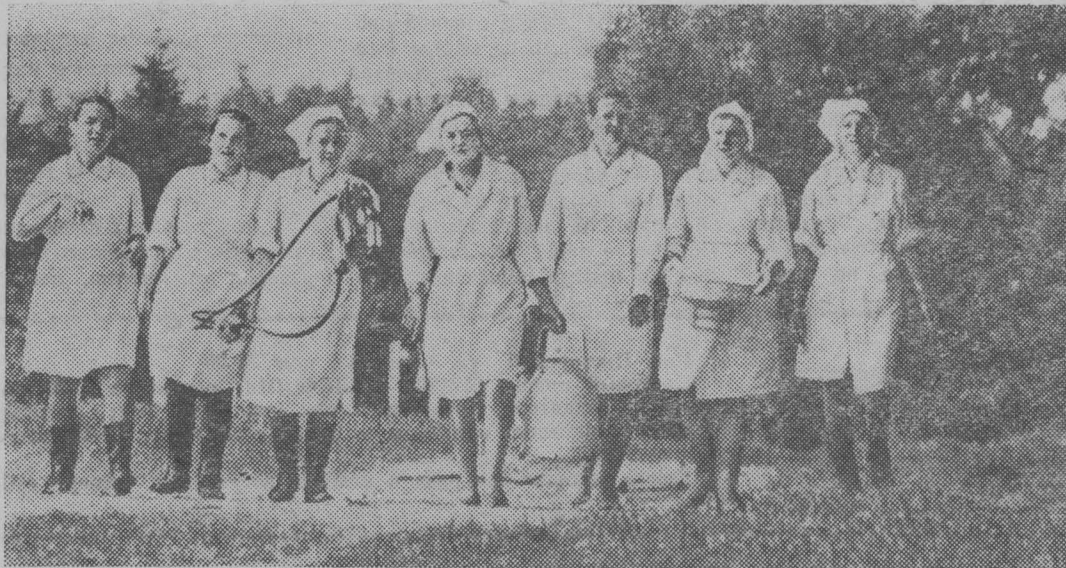
НА СНИМКЕ: доярки колхоза «Паеис» Каунасского района направляются на работу.

* За день в Литовской ССР выпускается 6450 тонн минеральных удобрений. Каждые три минуты с конвейера сходит 4 телевизора. Каждые две минуты — 3 велосипеда.