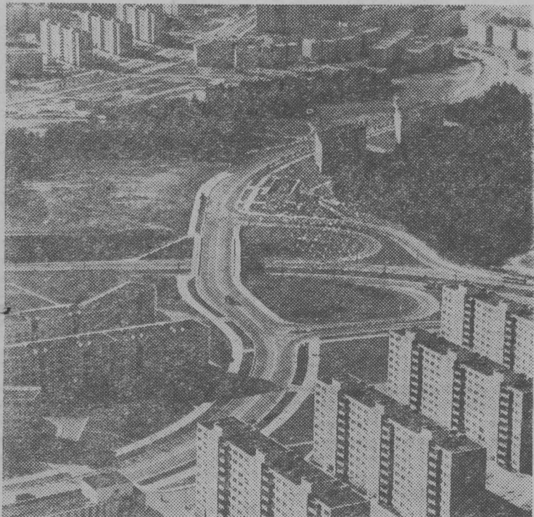
Столица Литовской ССР—Вильнюс. Новые жилые кварталы в районе Лаздинай.