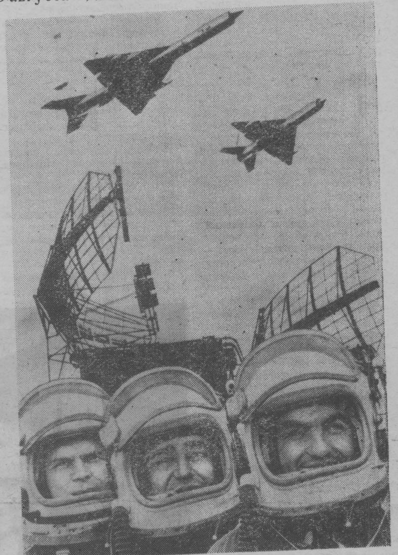
Слава советской авиации! Фотоплакат Н. Акимова

ОБРАЩЕНИЕ ПРИНЯТО НА СОВЕЩАНИИ ПЕРЕДОВЫХ КОМБАЙНЕРОВ И ШОФЕРОВ