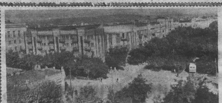
Сегодня исполняется 50 лет со дня образования Чечено-Ингушской АССР.

Чечено-Ингушская Автономная Советская Социалистическая Республика расположена на Северном Кавказе, входит в состав Российской Федерации. Основное население — чеченцы, ингуши и русские. В республике развиты нефтедобывающая, нефтеперерабатывающая, химическая, пищевая промышленность, скотоводство. В столице Чечено-Ингушетии Грозном проживает около 300 тысяч жителей.