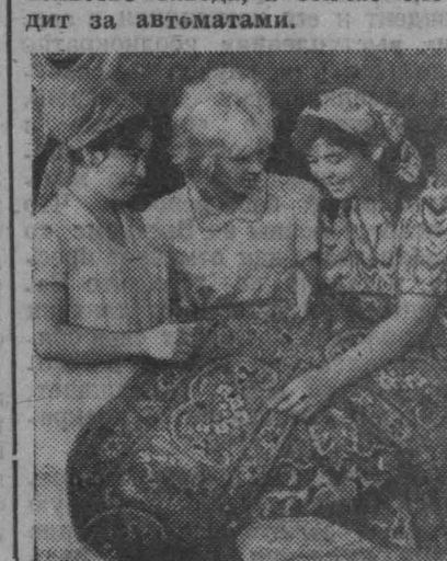
ТАДЖИКСКАЯ ССР. Кайракумский ковровый комбинат имени В. И. Ленина — передовое предприятие республики. Оно выпускает до трех с половиной миллионов квадратных метров ковровых изделий в год.