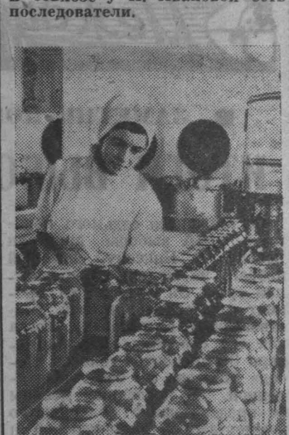
ЗАКАРПАТСКАЯ ОБЛАСТЬ В колхозе «Пригородник» Хустского района работает консервный завод, оснащенный новым оборудованием. В этом году он даст около двух миллионов банок различных консервов: овощных салатов, маринованных помидоров и огурцов, компотов из слив, яблок и других фруктов.