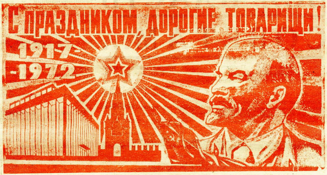
Плакат художника Э. Лука-сиса. (Издательство «Московская правда»).

С ПРАЗДНИКОМ ВАС, ДОРОГИЕ ТОВАРИЩИ! Районный комитет КПСС | Исполком районного Совета