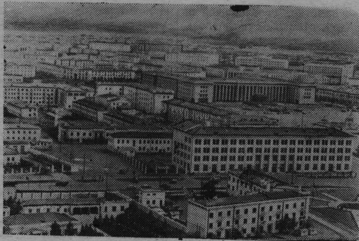
Столица Народной Республики Монголии Улан-Батор. (Вид с вертолета).