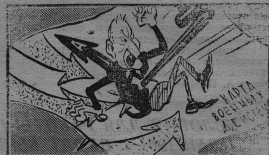
так и откликнется!