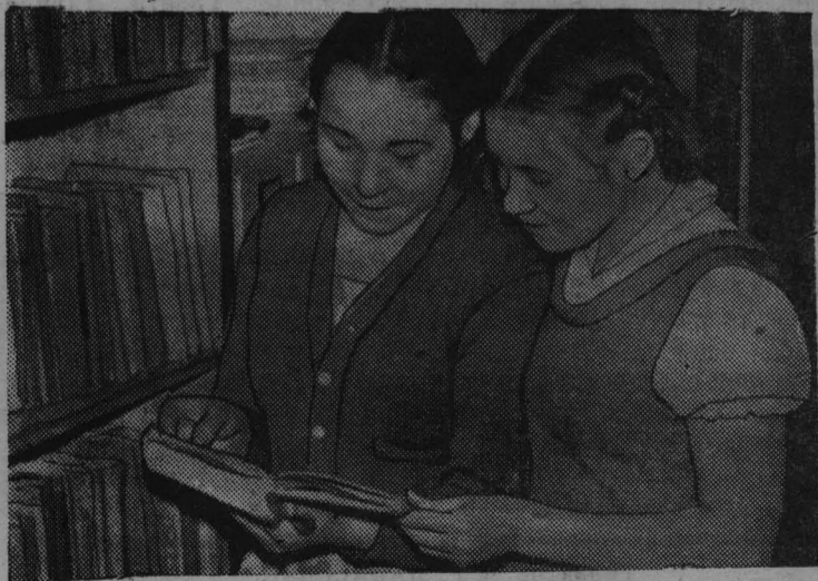
Юные друзья книги.