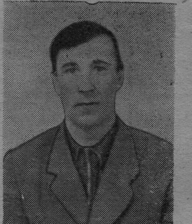
Фото и текст Г. Лучевникова.

В работе он всегда аккуратен, старательно ухаживает за животными. Своими трудовыми делами он являет пример для других рабочих совхоза. В 1961 году — в 3-ем году семилетки он решил трудиться еще лучше и добиться еще более высоких показателей в работе.