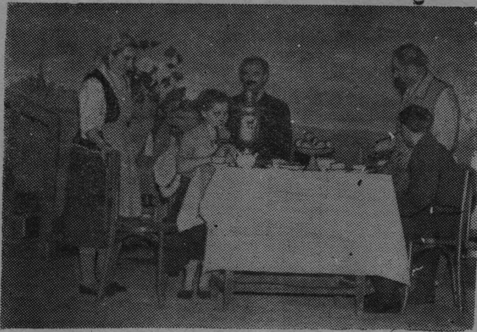
На снимке: сцена из пьесы Анатолия Софронова «СТРЯПУ-ХА» в постановке коллектива художественной самодеятельности Ижморского РДК.