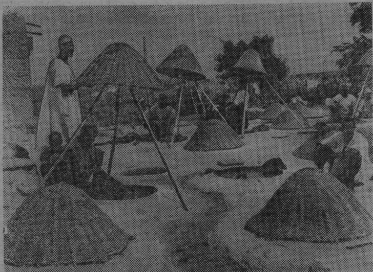
НИГЕРИЯ. Кустарная красильная мастерская под открытым небом.

Рабат, 25 декабря (ТАСС). В Марокко из Конго вчера возвратился первый контингент марокканских войск. Это является первым этапом в выполнении решения Совета Министров Марокко об отзыве марокканских войск из под командования ООН.