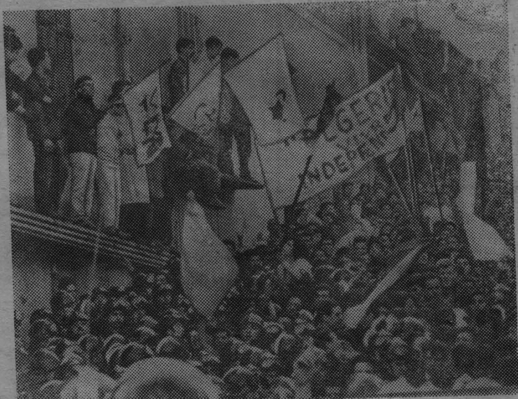
В крупных алжирских городах продолжаются массовые манифестации.

Патриоты Алжира требуют предоставления независимости. Карательные действия французских властей, убийства мирного и безоружного населения не сломят решимости свободолюбивого алжирского народа.