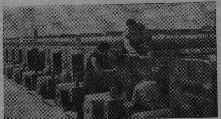
Румынская Народная Республика—страна развитой текстильной промышленности. Через несколько лет крупнейшее текстильное предприятие Бухареста «Филатура ромынеаскэ де бумбак» нельзя будет узнать. Здесь возводятся новые цехи, часть которых уже вошла в строй. Большинство установленных машин отечественного производства.

А вот морская рыба астроксип умеет убивать взглядом добычу. И глаза и рот расположены у нее на спине. Если в поле зрения попадет небольшой малек, пригодный астроксипу в пищу, хищник посылает в его сторону электрический разряд. Парализованный малек падает вниз—прямо в разинутый рот хищника.