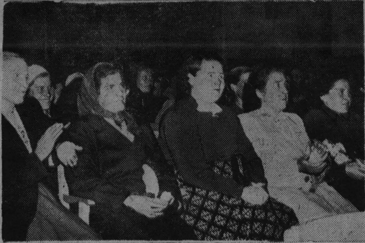
На снимке: в зале Ижморского районного Дома культуры на тематическом вечере женщин.