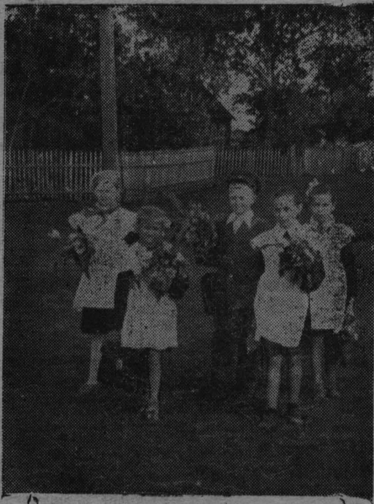
1 сентября. В школу.

Перед школой, перед учителем стоит благородная цель—растить человека сочетающего духовное богатство и физическое совер-