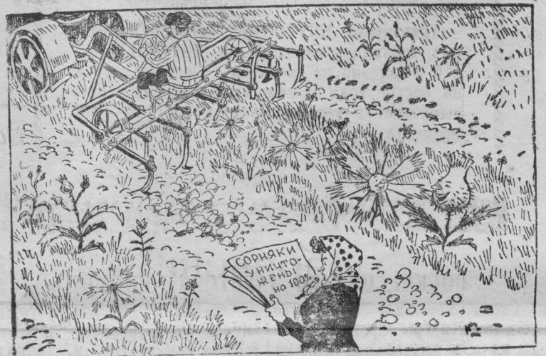
СОРНЯКИ:—Что учетчица нас уничтожила—это не страшно. Главное, что мы культиватору в лапы не попали!