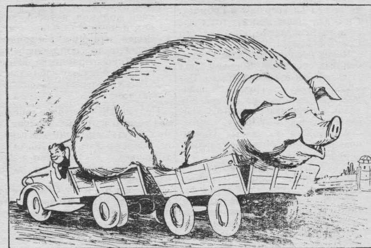
— Еду на выставку на других посмотреть и себя показать.

Экономическая конференция прошла при высокой активности участников и принесла большую пользу всем присутствовавшим, которые высказали просьбу и впредь практиковать проведение таких конференций.