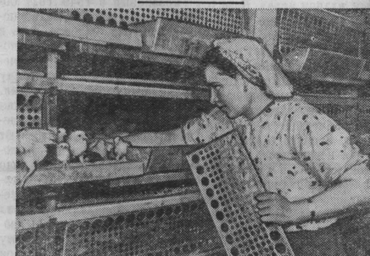
Иркутская область. Птицеводство — самая скороспелая отрасль животноводства. Решив по сравнению с прошлым годом произвести в 4 раза больше мяса, колхоз имени Парижской коммуны Тулунского района намного увеличил поголовье птиц.