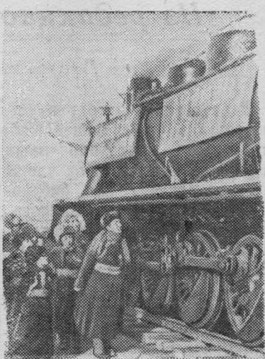
В Китайской Народной Республике построена китайская часть железной дороги Цзинин—Улан-Батор протяженностью 338 километров. Построенная линия идет от Цзинина во Внутренней Монголии до китайско-монгольской границы, где она соединяется с линией, идущей на Улан-Батор.