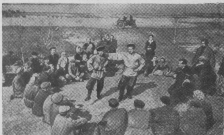
Брянская область. Агитбригада Климовского районного Дома культуры во время весенних работ часто выезжает на полевые станы, выступает перед колхозниками с концертами художественной самодеятельности.

В Ижморской книжной магазин поступила новая литература. Бела Иллеш. Тисса горит. Ромен Роллан. Очарованная душа, II том.