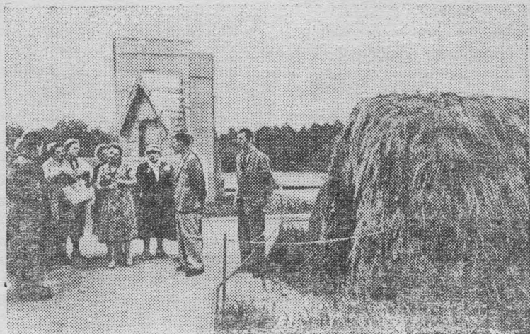
На снимке: группа членов делегации сторонников мира Финляндии у памятника-шалаша В. И. Ленина в Разливе (у северного берега Финского залива близ Ленинграда).

Мария Ильинична говорила мне потом, что Владимир Ильич очень жалел, что не научился играть на рояле или на скрипке.