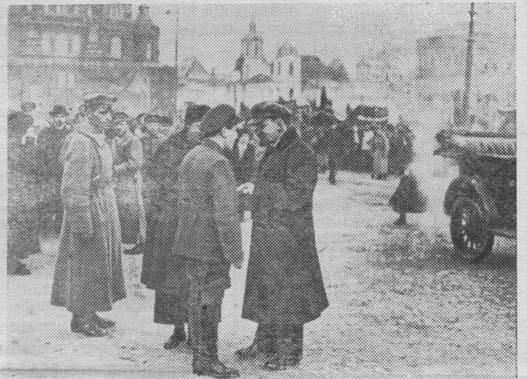
Владимир Ильич Ленин на Красной площади. 1919 год.

Самым лучшим ему памятником будет сохранять, развивать и не терять ни на одну минуту основной цели — полной победы рабочих и крестьян над угнетателями во всем мире.