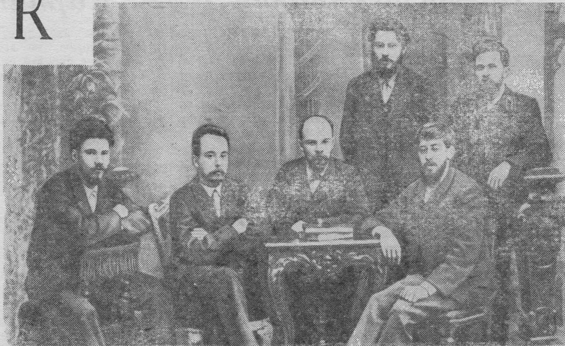
В. И. Ленин в группе членов Петербургского „Союза борьбы за освобождение рабочего класса“. 1897 год.

Затем, уже в годы Советской власти, я навещал Ленина в Москве, в Кремле, и всегда встречал с его стороны теплый и сердечный прием.