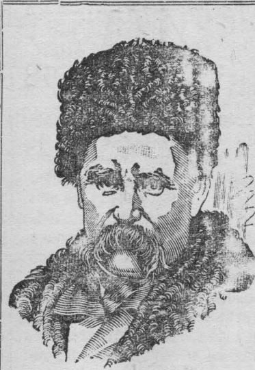
Тарас Григорьевич ШЕВЧЕНКО