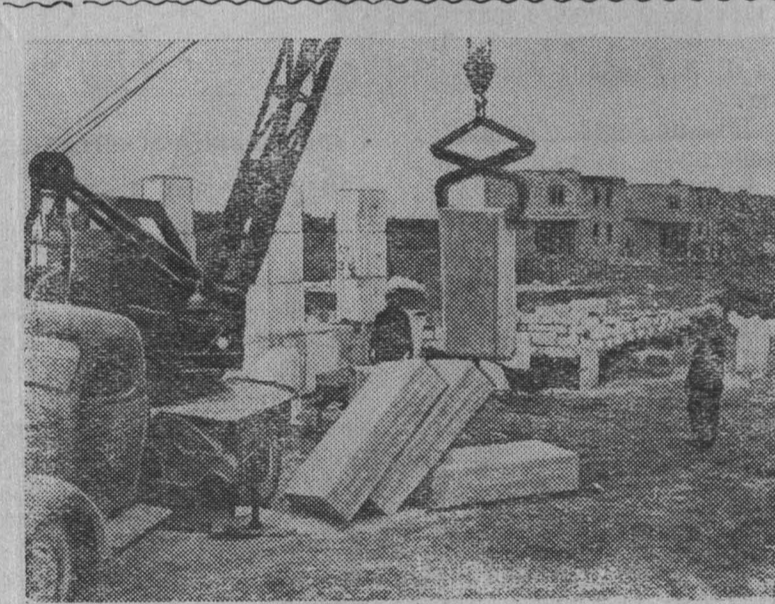
КРЫМСКАЯ ОБЛАСТЬ. В колхозе «Дружба народов» Красногвардейского района началось строительство нового поселка. Здесь будет сооружено 500 двухквартирных жилых домов на 1000 квартир со всеми удобствами, в том числе с центральным отоплением. Каждая квартира состоит из трех комнат, кухни, ванной и душевой. Одновременно строятся из крупных блоков здание колхозной школы-интерната, в которой будут жить и обучаться 520 детей. В колхозном городке размещается Дом культуры, магазин, рестораны, пекарня и другие бытовые учреждения. В центральной части поселка намечено разбить парк. На снимке: строительство поселка в колхозе «Дружба народов». На переднем плане—сооружение здания школы-интерната из крупных блоков.

лей дала возможность только в нашей артели сэкономить около 75 тысяч рублей, или почти миллион рублей деньгами. В мирном соревновании с американцами мы добьемся новых успехов и обязательно выйдем победителями. ТАСС.