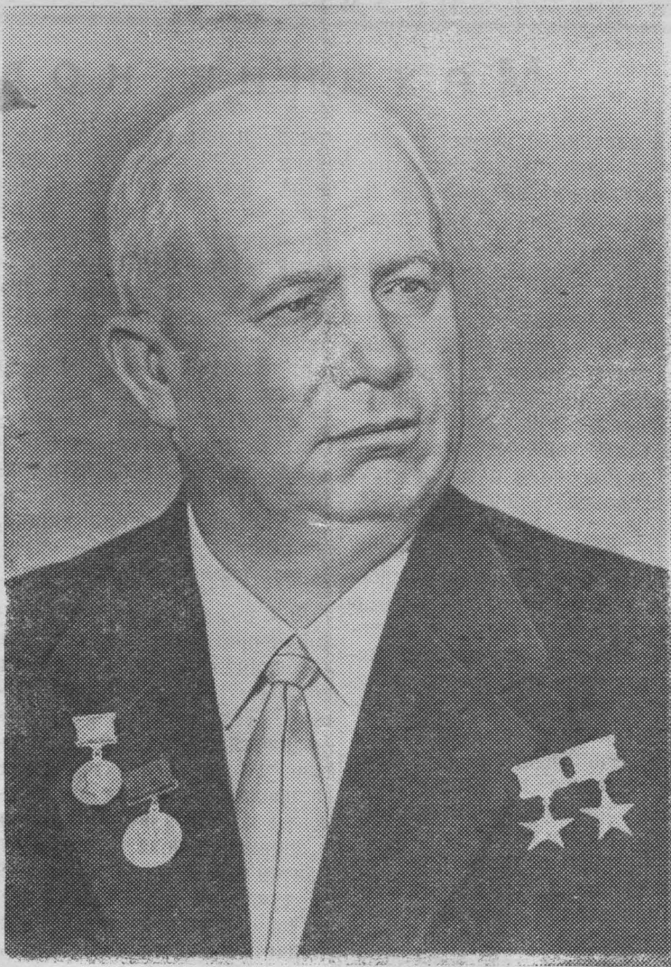
Первый секретарь ЦК КПСС, член Президиума ЦК КПСС, Председатель Совета Министров СССР Никита Сергеевич Хрущев.

Н. С. Хрущева встречали товарищи А. Б. Аристов, Л. И. Брежнев, К. Е. Ворошилов, Н. Г. Игнатов, А. И. Кириченко, Ф. Р. Козлов, О. В. Куусинен, А. И. Микоян, Н. А. Мухитдинов, Е. А. Фурцева, П. Н. Поспелов, Д. Ф. Коротченко, Я. Э. Каллиберзин, А. П. Кириленко, А. Н. Косыгин, К. Т. Мазуров, В. П. Мжаванадзе, М. Г. Первухин, Н. В. Подгорный, Д. С. Полянский и другие.