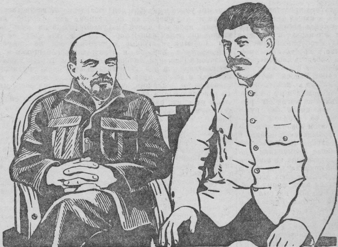
В. И. Ленин и И. В. Сталин в Горках под Москвой 1922 г.

Фашизм обречен и будет сметен с лица земли в вихре народного гнева и победоносного восстания! Мы уверенно и бодро смотрим вперед, потому что нас ведет вперед великий Сталин, нас ведет испытанная в боях непобедимая партия Ленина—Сталина. Будущее за нами! Идеи марксизма-ленинизма победят во всем мире!